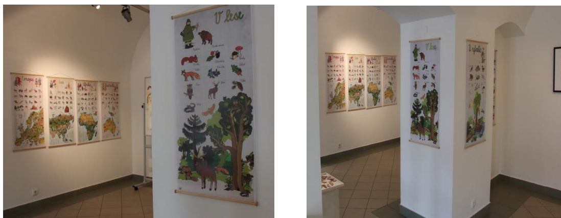
Výstava „Dětem“ – 70 let ZUŠ

V rámci oslav 70 let vzniku naší školy učitelé výtvarného oboru uspořádali výstavu svých prací zaměřené na dětský svět.