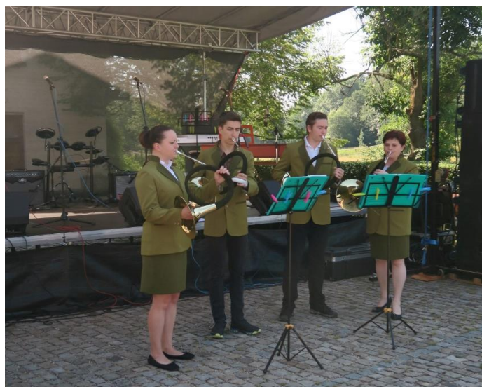
Soubor loveckých nástrojů