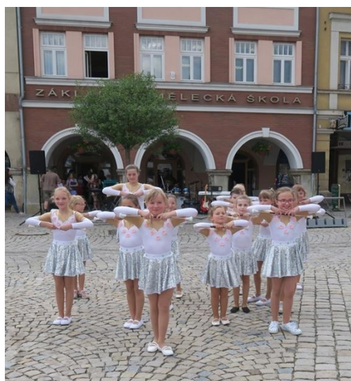
ZUŠ Open 2019

Výroční zprávu zpracovala: Tereza Rejlová