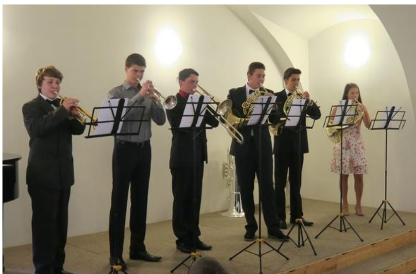
Absolventský koncert (absolventi dechového žesťového odd.)

V letošním školním roce 2018/2019 se dechové oddělení jako celek dynamicky rozvíjelo a účastnilo velice rozmanitých akcí, koncertů. Spolupráce učitelů je více než nadstandardní, a to i na poli nejrůznějších porad, konzultací, vzájemné pomoci i ústupků, jež sledují vždy jeden společný cíl – dobré jméno školy, spokojenost žáků i rodičů.