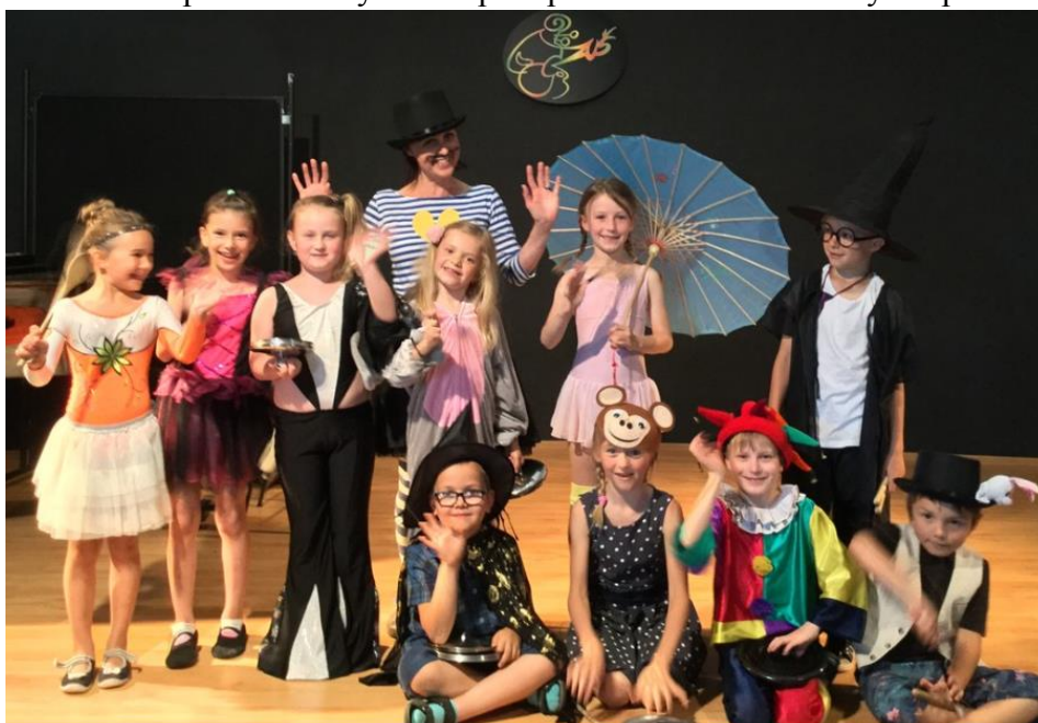
Přípravná hudební výchova – závěrečný koncert „Cirkus“

Červen 2019 – závěrečný koncert PHV – tentokrát se nejmenší muzikanti představili v programu, který se nesl v cirkusovém duchu. Děti společně zazpívaly tři umělé písně a každý žák se poté představil v sólovém vystoupení.