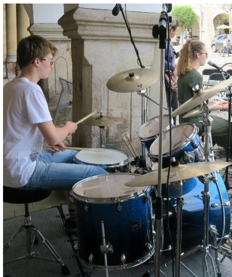
ZUŠ Open 2019

Žáci bicího oddělení začali v tomto školním roce vystupovat pravidelně na školních koncertech.