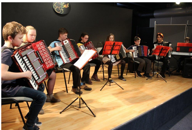
Akordeonový soubor Komořinka