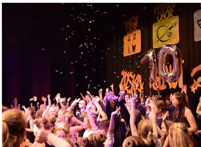
Hankův dům představení „Slavíme“

TO se těší opravdu velkému zájmu z řad nových uchazečů, kteří by rádi navštěvovali náš obor. Věříme, že je to také forma zpětné vazby, a proto si toho velice vážíme.